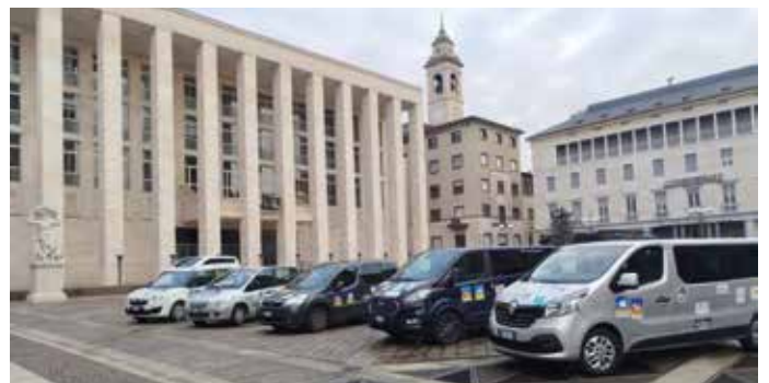
I mezzi dell'ANMIC di Bergamo per il trasporto dei disabili esposti in piazza della Libertà nel giorno del Congresso provinciale