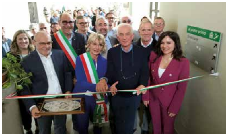
Taglio del nastro con le autorità all'inaugurazione dell'Ospedale di Comunità di Calcinante

Nello scorso mese di ottobre a Calcinante è stato inaugurato l'Ospedale di Comunità alla presenza dell'assessore regionale al Welfare, Guido Bertolaso. Finanziata con 2,1 milioni di euro del PNRR, la nuova struttura è stata progettata per offrire assistenza a pazienti che non necessitano di ricoveri ospedalieri complessi, fungendo da "filtro tra medicina territoriale e ospedaliera", come ha sottolineato lo stesso assessore. Bertolaso lo ha definito "un tassello importante nel completamento del sistema sanitario