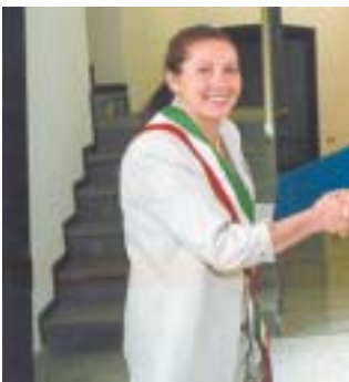
L'amministrazione di Grumello del Monte ha ricordato «don Gere»

La sezione Anmic della Valle Imagna ha organizzato dal 16 al 23 giugno, presso l'oratorio parrocchiale di Ponte Giurino, frazione di Berbenno, la partecipata manifestazione dedicata all'handicap con l'esposizione dei lavori artigianali creati dalle diverse cooperative della