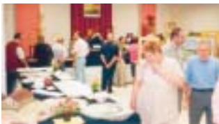
Molti visitatori alla mostra di Ponte Giurino