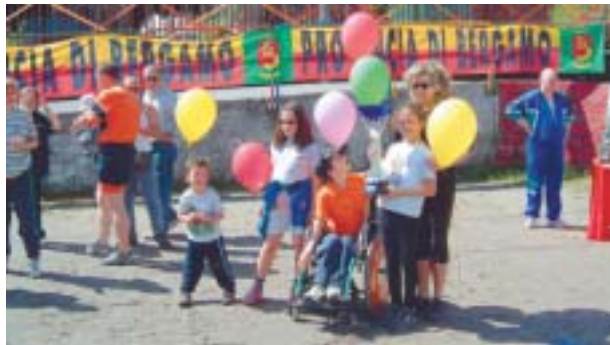
Un momento di festa tra bandiere e palloncini, giochi e risate a Ponte Giurino