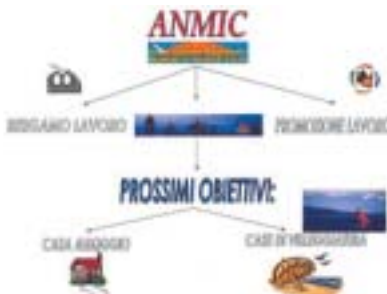
I nuovi progetti dell'associazione e quelli in via di realizzazione: da Promozione lavoro a una casa alloggio