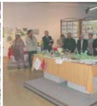
Lavori artigianali e disegni in mostra a San Giovanni Bianco