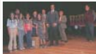
Un gruppo di vincitori del concorso «Handicap 2000»