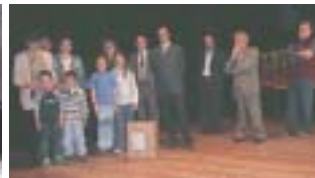
Ragazzi premiati nella mostra concorso «Handicap 2000»