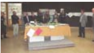
La mostra «Handicap 2000» si ripeterà in diversi paesi

provincia di Bergamo. Lavori in ferro, legno, ricami, suppellettili e dipinti provenienti dalla cooperativa Bergamo Lavoro, dalla cooperativa Comunità Valle Imagna, dalla cooperativa Dell'Isola, dalla cooperativa «Il Segno» di Ponte S. Pietro, dalla cooperativa «Ragazzi Down» di Dalmine e dalla sezione Anmic della Valle Brembilla sono stati esposti e lungamente ammirati nelle sale dell'oratorio.